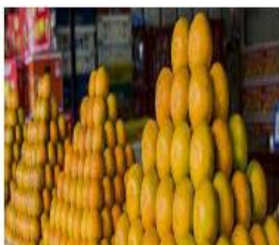
ร้านที่ ๒ ส้ม ราคา ๒๕ บาท สด หวาน และมีราคาต่ำ

๑. เปรียบเทียบสินค้าในการเลือกซื้อสินค้ามาบริโภคตามอุปสงค์และอุปทานเป็นตัวกำหนด