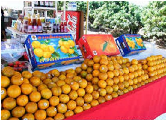
ร้านที่ ๑ ส้ม ราคา ๓๕ บาท หอม หวาน แต่มีราคาสูง

คำชี้แจง: ให้นักเรียนแต่ละกลุ่มระดมความคิดปัจจัยที่กำหนดปริมาณสินค้าและบริการ