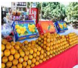
ร้านที่ ๑ ส้ม ราคา ๓๕ บาท หอม หวาน แต่มีราคาสูง

คำชี้แจง: ให้นักเรียนแต่ละกลุ่มระดมความคิดปัจจัยที่กำหนดปริมาณสินค้าและบริการ