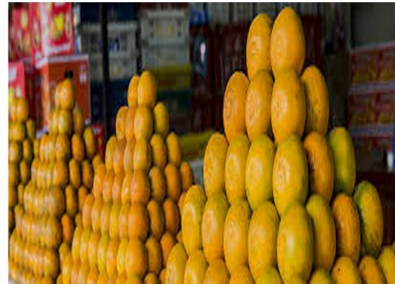
ร้านที่ ๒ ส้ม ราคา ๒๕ บาท สด หวาน และมีราคาต่ำ

๑. เปรียบเทียบสินค้าในการเลือกซื้อสินค้ามาบริโภคตามอุปสงค์และอุปทานเป็นตัวกำหนด