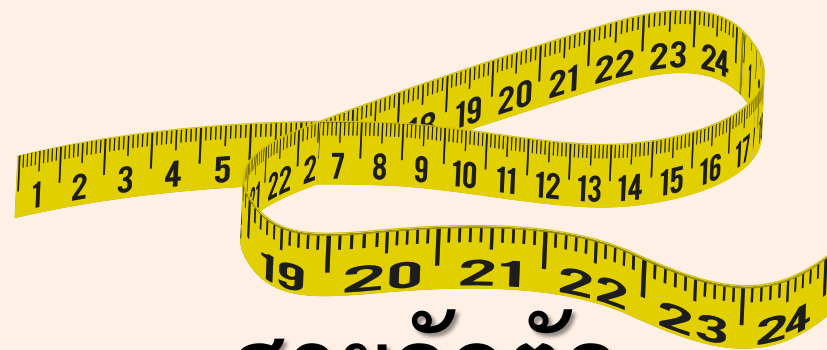
สายวัดตัว