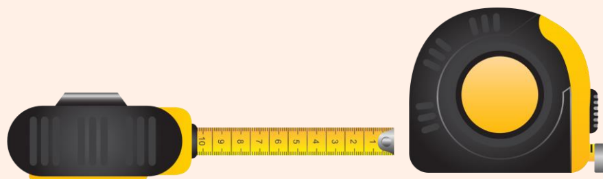
สายวัดชนิดตลับ