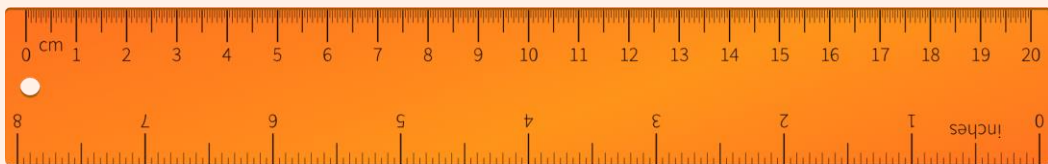
ไม้บรรทัด