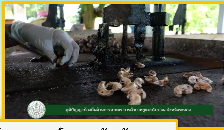
ตัวอย่างภาพ ภูมิปัญญาด้านการเกษตร การคั่วกาหยูแบบโบราณ จังหวัดระนอง