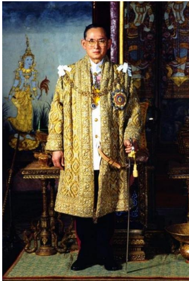
พระบาทสมเด็จพระบรมชนกาธิเบศร มหาภูมิพลอดุลยเดชมหาราช บรมนาถบพิตร

พระบาทสมเด็จพระบรมชนกาธิเบศร มหาภูมิพลอดุลยเดชมหาราช บรมนาถบพิตร พระราชสมภพเมื่อวันที่ ๕ ธันวาคม พ.ศ. ๒๔๗๐ เป็นพระราชโอรสสมเด็จพระมหิตลาธิเบศร อดุลยเดชวิกรม พระบรมราชชนก (สมเด็จพระเจ้าฟ้ามหิตลอดุลเดช กรมหลวงสงขลานครินทร์ พระราชโอรสในรัชกาลที่ ๕) และสมเด็จพระศรีนครินทราบรมราชชนนี (หม่อมสังวาลย์ มหิตล) และทรงเป็นพระอนุชาในพระบาทสมเด็จพระปรเมนทรมหาอานันทมหิดล พระอัฐมรามาธิบดินทร เสด็จขึ้นครองราชสมบัติเป็นพระมหากษัตริย์รัชกาลที่ ๙ แห่งพระบรมราชจักรีวงศ์ สืบต่อจากพระเชษฐาเมื่อวันที่ ๙ มิถุนายน พ.ศ. ๒๔๘๙ พระบาทสมเด็จพระมหาภูมิพลอดุลยเดชมหาราช บรมนาถบพิตร ทรงอภิเษกสมรสกับสมเด็จพระนางเจ้าสิริกิติ์ พระบรมราชินีนาถ พระบรมราชชนนีพันปีหลวง (หม่อมราชวงศ์สิริกิติ์ กิติยากร) เมื่อวันที่ ๒๘ เมษายน พ.ศ. ๒๔๙๓ มีพระราชโอรสธิดารวม ๔ พระองค์