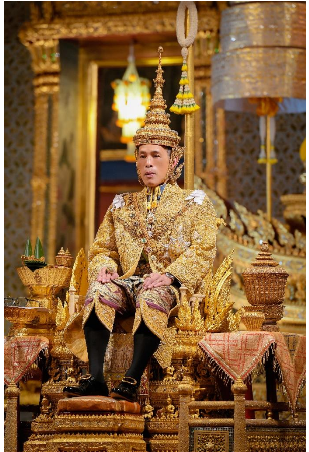
พระบาทสมเด็จพระวชิรเกล้าเจ้าอยู่หัว