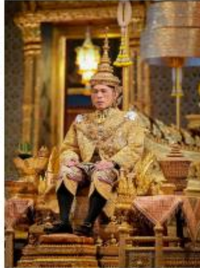
พระบาทสมเด็จพระวชิรเกล้าเจ้าอยู่หัว

พระบาทสมเด็จพระวชิรเกล้าเจ้าอยู่หัว พระราชสมภพเมื่อวันที่ ๒๘ กรกฎาคม พ.ศ. ๒๕๑๕ เป็นพระราชโอรสในพระบาทสมเด็จพระบรมชนกาธิเบศร มหาภูมิพลอดุลยเดชมหาราช บรมนาถบพิตร และสมเด็จพระนางเจ้าสิริกิติ์ พระบรมราชินีนาถ พระบรมราชชนนีพันปีหลวง มีพระนามเมื่อแรกประสูติว่า สมเด็จพระเจ้าพี่นางเธอ เจ้าสุทนต์มณี ทรงดำรงสมณศักดิ์เป็นพระมหากษัตริย์รัชกาลที่ ๑๐ แห่งพระบรมราชจักรีวงศ์ สืบต่อจากสมเด็จพระบรมชนกนาถเมื่อวันที่ ๑๓ ตุลาคม พ.ศ. ๒๕๕๙