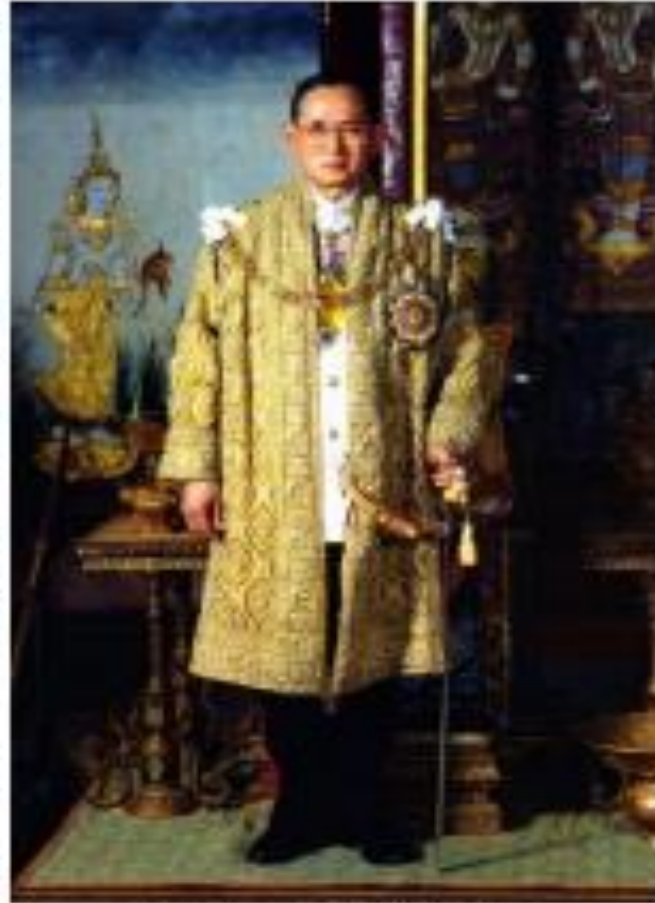
พระบาทสมเด็จพระบรมชนกาธิเบศร มหาภูมิพลอดุลยเดชมหาราช บรมนาถบพิตร

พระบาทสมเด็จพระบรมชนกาธิเบศร มหาภูมิพลอดุลยเดชมหาราช บรมนาถบพิตร พระราชสมภพเมื่อวันที่ ๕ ธันวาคม พ.ศ. ๒๔๗๐ เป็นพระราชโอรสสมเด็จพระมหิตลาธิเบศร อดุลยเดชวิกรม พระบรมราชชนก (สมเด็จพระเจ้าพี่นางเธอเจ้าฟ้ากัลยาณิวัฒนา กรมหลวงนงนุช) พระราชโอรสในรัชกาลที่ ๘ และสมเด็จพระศรีนครินทราบรมราชชนนี (หม่อมราชวงศ์รำไพพรรณี) และทรงเป็นพระอนุชาในพระบาทสมเด็จพระปรเมนทรมหาอานันทมหิดล พระอัฐมรามาธิบดินทร เสด็จขึ้นครองราชสมบัติเป็นพระมหากษัตริย์รัชกาลที่ ๙ แห่งพระบรมราชจักรีวงศ์ สืบต่อจากพระเชษฐาเมื่อวันที่ ๙ มิถุนายน พ.ศ. ๒๔๙๔ พระบาทสมเด็จพระมหาภูมิพลอดุลยเดชมหาราช บรมนาถบพิตร ทรงอภิเษกสมรสกับสมเด็จพระนางเจ้าสิริกิติ์ พระบรมราชินีนาถ พระบรมราชชนนีพันปีหลวง (หม่อมราชวงศ์สิริกิติ์ กิติยากร) เมื่อวันที่ ๒๘ เมษายน พ.ศ. ๒๔๙๓ มีพระราชโอรสธิดารวม ๔ พระองค์