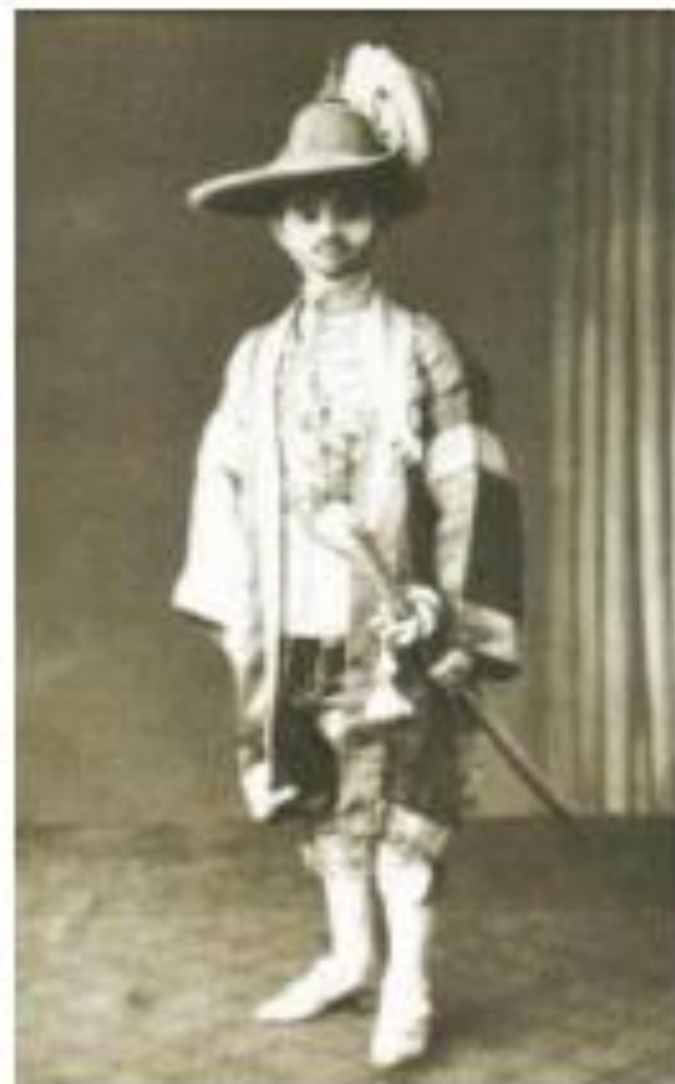
พระบาทสมเด็จพระปกเกล้าเจ้าอยู่หัว

พระบาทสมเด็จพระปกเกล้าเจ้าอยู่หัว พระนามเดิมว่า สมเด็จพระเจ้าพี่นางเธอเจ้าฟ้ากัลยาณิวัฒนา กรมหลวงนราธิวาสราชนครินทร์ พระราชสมภพเมื่อวันที่ ๘ พฤศจิกายน พ.ศ. ๒๔๓๒ เป็นพระราชโอรสพระองค์สุดท้ายในพระบาทสมเด็จพระจุลจอมเกล้าเจ้าอยู่หัว (รัชกาลที่ ๕) และสมเด็จพระศรีพัชรินทราบรมราชินีนาถ พระบรมราชชนนี ทรงอภิเษกสมรสกับสมเด็จพระนางเจ้ารำไพพรรณี พระบรมราชินี (หม่อมเจ้าหญิงรำไพพรรณี สวัสดิวัตน์) เสด็จขึ้นครองราชสมบัติเป็นพระมหากษัตริย์รัชกาลที่ ๗ แห่งพระบรมราชจักรีวงศ์ สืบต่อจากพระเชษฐา คือ พระบาทสมเด็จพระมงกุฎเกล้าเจ้าอยู่หัว (รัชกาลที่ ๖) เมื่อวันที่ ๒๖ พฤศจิกายน พ.ศ. ๒๔๖๘