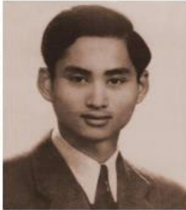
พระบาทสมเด็จพระปรเมนทรมหาอานันทมหิดล พระอัฐมรามาธิบดินทร

พระบาทสมเด็จพระปรเมนทรมหาอานันทมหิดล พระอัฐมรามาธิบดินทร พระราชสมภพเมื่อวันที่ ๒๐ กันยายน พ.ศ. ๒๔๖๘ ทรงมีพระชาติกำเนิดเป็นหม่อมเจ้า มีพระนามเดิมว่า หม่อมเจ้าอานันทมหิดล เป็นพระราชโอรสสมเด็จพระมหิตลาธิเบศร อดุลยเดชวิกรม พระบรมราชชนก (สมเด็จพระเจ้าสามทิพย์ยศุเสศ กรมหลวงสงขลานครินทร์ พระราชโอรสในรัชกาลที่ ๕) และสมเด็จพระศรีนครินทร์ราชบรมราชชนนี (หม่อมสังวาลย์ มหิดล) เสด็จขึ้นครองราชสมบัติเป็นพระมหากษัตริย์รัชกาลที่ ๘ แห่งพระบรมราชจักรีวงศ์ สืบต่อจากพระปิตุลา คือ พระบาทสมเด็จพระปกเกล้าเจ้าอยู่หัว ที่ทรงสละราชสมบัติเมื่อวันที่ ๒ มีนาคม พ.ศ. ๒๔๗๕ ขณะมีพระชนมายุได้ ๕ พรรษา