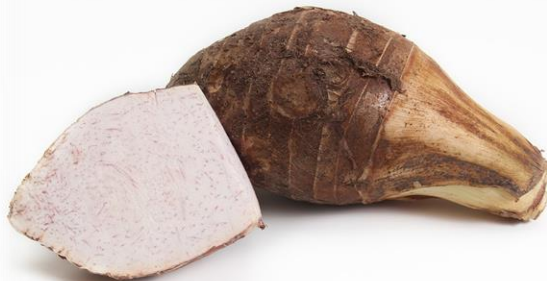
เผือก (ยุ่ง, จุ้นจ้าน)

ขอบคุณภาพลำไยจาก PIXABAY by Bigtreegroup