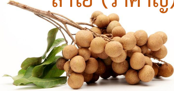
ลำไย (รำคาญ)