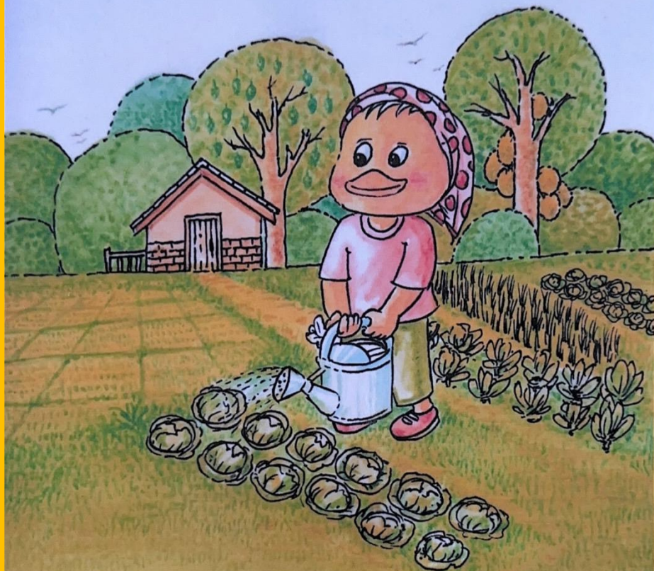
เปิดปลูกผัก น่านิยม