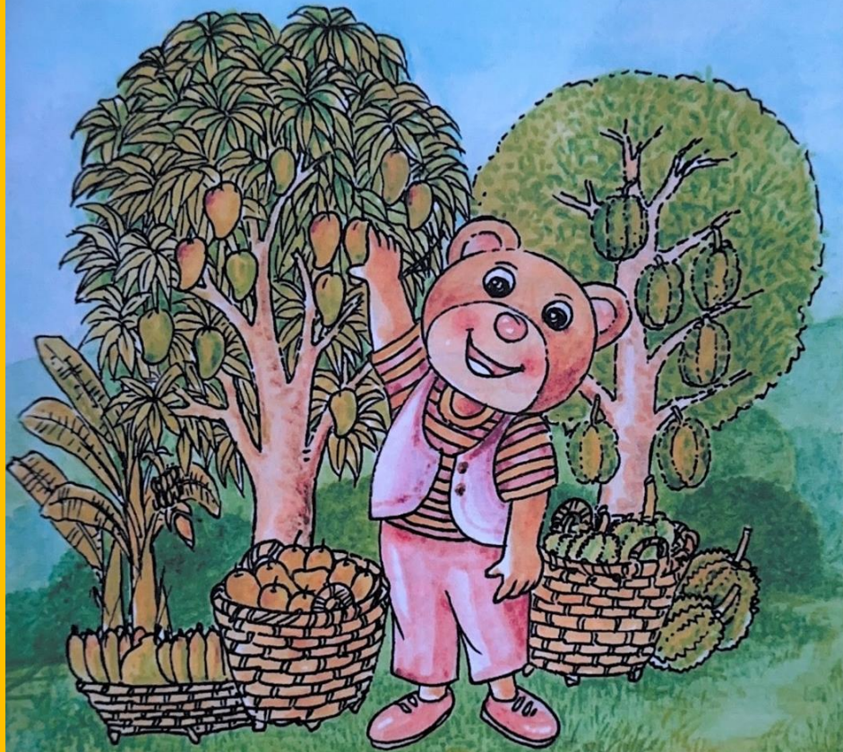
หมีปลูกไม้ผล น่าสนใจ