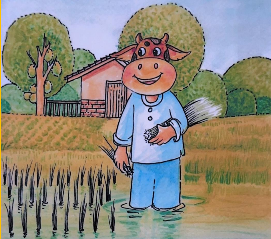
วัวปลูกข้าว นำชื่นชม