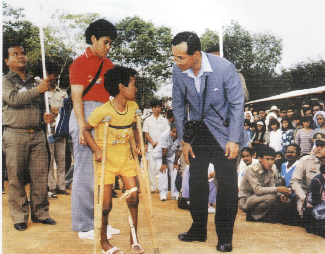
พระบาทสมเด็จพระเจ้าอยู่หัวมีพระราชปฏิสันถารกับเด็กหญิงผู้ป่วยเป็นโรคโปลิโอที่สวมเหล็กช่วยพยุงขา