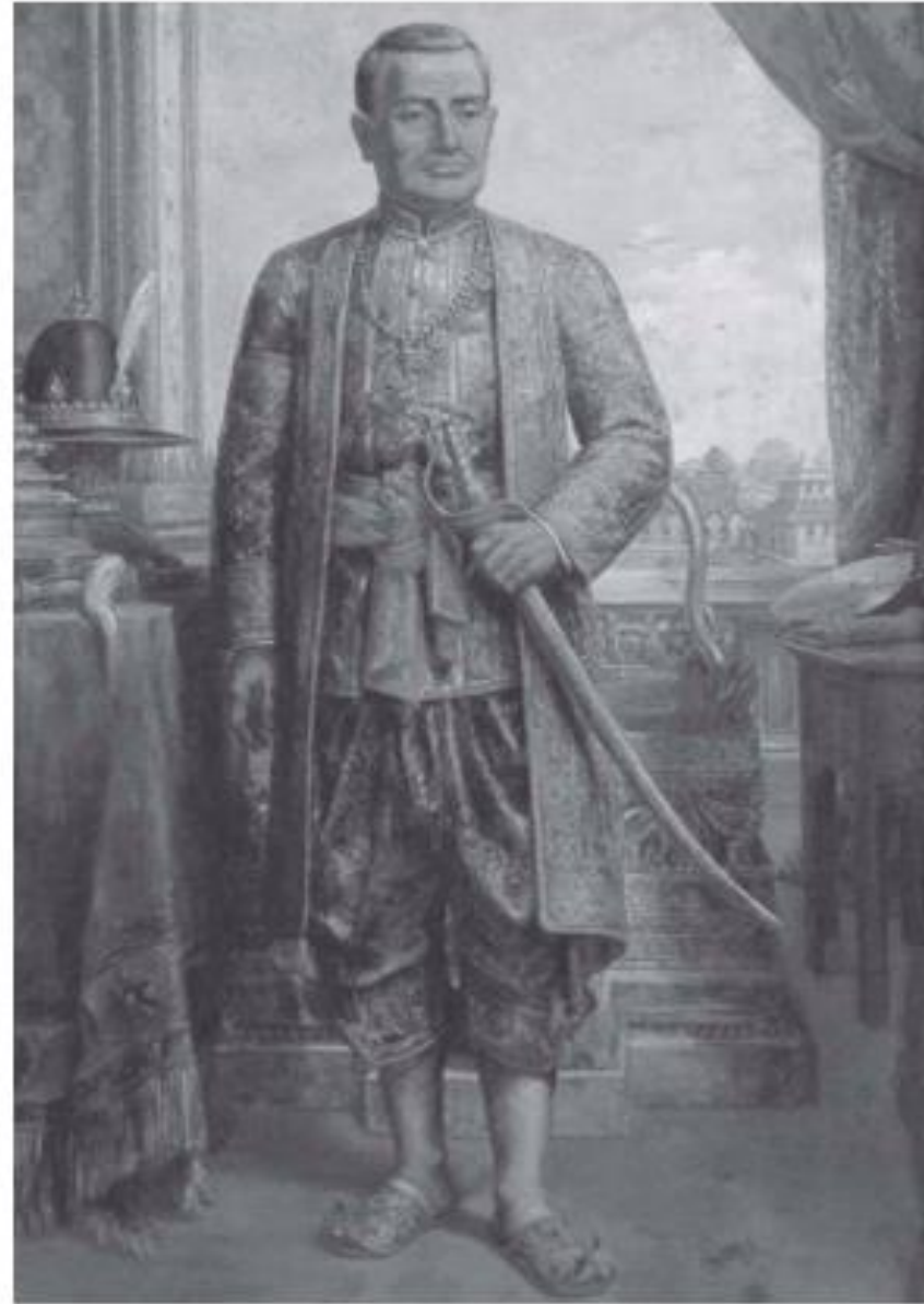
พระบาทสมเด็จพระพุทธยอดฟ้าจุฬาโลกมหาราช

พระมหากษัตริย์รัชกาลที่ ๑ แห่งกรุงรัตนโกสินทร์ มีพระนามเดิมว่า ตัวง หรือทองตัวง เสด็จพระราชสมภพที่กรุงศรีอยุธยา เมื่อวันที่ ๒๐ มีนาคม พ.ศ. ๒๒๗๕ ในรัชกาลสมเด็จพระเจ้าอยู่หัวบรมโกศเป็นพระโอรสในสมเด็จพระปฐมมหาชนกซึ่งมีพระนามเดิมว่า ทองดี สืบเชื้อสายมาจาก เจ้าพระยาโกษาธิบดี (ปาน) ในสมัยสมเด็จพระนารายณ์มหาราช พระราชชนนีมีพระนามว่า ทยก หรือดาวเรือง เมื่อทรงเจริญพระชนมพรรษาได้ถวายตัวเป็นมหาดเล็กในสมเด็จพระเจ้าอยู่หัวมอญ ขณะดำรงพระยศเป็นสมเด็จพระเจ้าลูกยาเธอ เมื่อทรงอุปสมบทและลาผนวชแล้วกลับเข้ารับราชการเป็นมหาดเล็กหลวง เมื่อมีพระชนมพรรษา ๒๕ พรรษา สมเด็จพระเจ้าเอกทัศ ทรงพระกรุณาโปรดเกล้าฯ ให้เป็นหลวงยกกระบัตรเมืองราชบุรี และได้สมรสกับธิดาตระกูลคหบดีที่ตำบลอัมพวา แขวงเมืองสมุทรสาคร ชื่อ นาก (สมเด็จพระอมรินทราบรมราชินี)