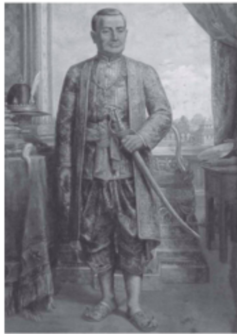
พระบาทสมเด็จพระพุทธยอดฟ้าจุฬาโลกมหาราช

พระบาทสมเด็จพระพุทธยอดฟ้าจุฬาโลกมหาราช พระมหากษัตริย์รัชกาลที่ ๑ แห่งกรุงรัตนโกสินทร์ มีพระนามเดิมว่า ค้าง หรือทองค้าง เสด็จพระราชสมภพที่กรุงศรีอยุธยา เมื่อวันที่ ๒๐ มีนาคม พ.ศ. ๒๒๗๘ ในรัชกาลสมเด็จพระเจ้าอยู่หัวบรมโกศเป็นพระโอรสในสมเด็จพระปฐมมหาชนกซึ่งมีพระนามเดิมว่า ทองดี สืบเชื้อสายมาจาก เจ้าพระยาโกษาธิบดี (ปาน) ในสมัยสมเด็จพระนารายณ์มหาราช พระราชชนนีมีพระนามว่า หยก หรือดาวเรือง เมื่อทรงเจริญพระชนมพรรษาได้ถวายตัวเป็นมหาดเล็กในสมเด็จพระเจ้าอยู่หัวมร ขณะดำรงพระยศเป็นสมเด็จพระเจ้าลูกยาเธอ เมื่อทรงอุปสมบทและลาผนวชแล้วกลับเข้ารับราชการเป็นมหาดเล็กหลวงเมื่อมีพระชนมพรรษา ๒๕ พรรษา สมเด็จพระเจ้าเอกทัศทรงพระกรุณาโปรดเกล้าฯ ให้เป็นหลวงยกกระบัตรเมืองราชบุรี และได้สมรสกับธิดาตระกูลคหบดีที่ตำบลอัมพวา แขวงเมืองสมุทรสาคร ชื่อ นาก (สมเด็จพระอมรินทราบรมราชินี)