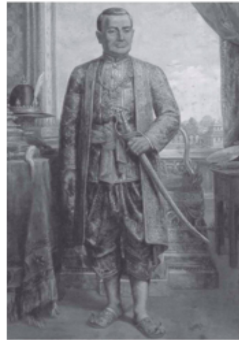
พระบาทสมเด็จพระพุทธยอดฟ้าจุฬาโลกมหาราช ที่มา : อนุสาวรีย์พระบาทสมเด็จพระพุทธยอดฟ้าจุฬาโลกมหาราช

พระบาทสมเด็จพระพุทธยอดฟ้าจุฬาโลกมหาราช พระมหากษัตริย์รัชกาลที่ ๑ แห่งกรุงรัตนโกสินทร์ มีพระนามเดิมว่า ค้าง หรือทองค้าง เสด็จพระราชสมภพที่กรุงศรีอยุธยา เมื่อวันที่ ๒๐ มีนาคม พ.ศ. ๒๒๗๘ ในรัชกาลสมเด็จพระเจ้าอยู่หัวบรมโกศเป็นพระโอรสในสมเด็จพระปฐมมหาชนกซึ่งมีพระนามเดิมว่า ทองดี สืบเชื้อสายมาจาก เจ้าพระยาโกษาธิบดี (ปาน) ในสมัยสมเด็จพระนารายณ์มหาราช พระราชชนนีมีพระนามว่า หยก หรือดาวเรือง เมื่อทรงเจริญพระชนมพรรษาได้ถวายตัวเป็นมหาดเล็กในสมเด็จพระเจ้าอยู่หัวมร ขณะดำรงพระยศเป็นสมเด็จพระเจ้าลูกยาเธอ เมื่อทรงอุปสมบทและลาผนวชแล้วกลับเข้ารับราชการเป็นมหาดเล็กหลวงเมื่อมีพระชนมพรรษา ๒๕ พรรษา สมเด็จพระเจ้าเอกทัศทรงพระกรุณาโปรดเกล้าฯ ให้เป็นหลวงยกกระบัตรเมืองราชบุรี และได้สมรสกับธิดาตระกูลคหบดีที่ตำบลอัมพวา แขวงเมืองสมุทรสาคร ชื่อ นาก (สมเด็จพระอมรินทราบรมราชินี)