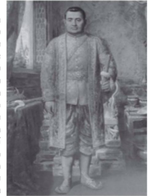
พระบาทสมเด็จพระนั่งเกล้าเจ้าอยู่หัว

พระบาทสมเด็จพระนั่งเกล้าเจ้าอยู่หัว พระนามเดิมว่าหม่อมเจ้าทับ เป็นพระราชโอรสในพระบาทสมเด็จพระพุทธเลิศหล้านภาลัย (ขณะทรงดำรงพระอิสริยยศเป็นสมเด็จพระเจ้าลูกยาเธอ เจ้าฟ้ากรมหลวงอิศรสุนทร) กับเจ้าจอมมารดาเขียว (ต่อมาภายหลังได้รับสถาปนาเป็นสมเด็จพระศรีสุลาลัย) เสด็จพระราชสมภพเมื่อวันที่ ๓๓ มีนาคม พ.ศ. ๒๓๓๐ ณ พระราชวังเดิมกรุงธนบุรี ในรัชสมัยพระบาทสมเด็จพระพุทธยอดฟ้าจุฬาโลกมหาราช ครั้น พ.ศ. ๒๓๕๗ สมเด็จพระราชปิตาภทรงได้รับอุปราชจากซิเชกเป็น พระมหาอุปราช ซึ่งทรงดำรงพระอิสริยยศเป็นพระเจ้าหลานเธอพระองค์เจ้าทับ พระบาทสมเด็จพระพุทธยอดฟ้าจุฬาโลกมหาราชทรงพระกรุณาโปรดเกล้าโปรดกระหม่อมให้ทำพิธีโสกันต์เป็นการพิเศษ และเมื่อครบปีก็จะทรงผนวชที่โปรดเกล้าฯ ให้ทรงพระผนวช ณ วัดพระศรีรัตนศาสดาราม แล้วเสด็จไปประทับ จำพรรษา ณ วัดราชสิทธาราม