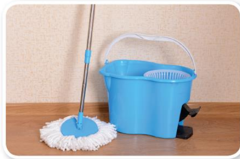
ใช้ผ้าถู