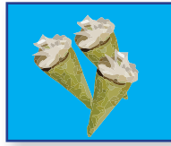
ขนมกล้วย