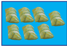
ข้าวต้มมัด

① ในงานเลี้ยง ครูเตรียมขนมไทยไว้ 3 ชนิด ชนิดละ 10 ชิ้น เมื่องานเลี้ยงเลิกมีขนมไทยเหลือดังนี้