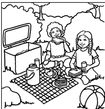
go for a picnic