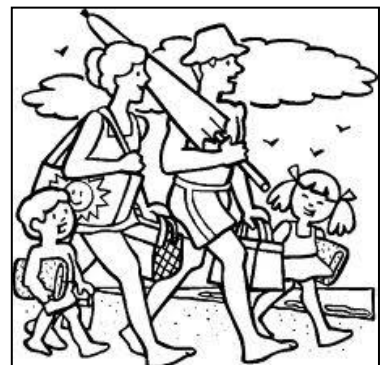
go to the beach

ชื่อ _____ สกุล _____ ชั้น _____ เลขที่ _____