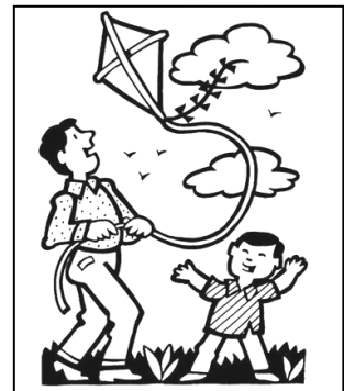
fly a kite