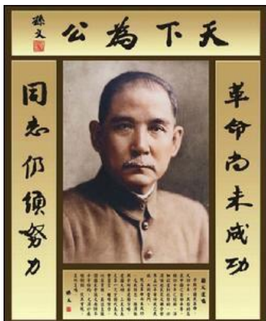
(ดร.ซุน ยัตเซน หัวหน้าพรรคก๊กมินตั๋ง)

๔. ต้นศตวรรษที่ ๑๙ ฝ้ายดิบและฝิ่นดิบเป็นสินค้าหลักที่นำเข้าสู่กว้างโจว แต่เนื่องจากประเทศจีนมีกฎหมายห้ามนำเข้าฝิ่น ทางอังกฤษจึงนำเข้าอย่างลับ ๆ โดยผ่านพ่อค้าจีนบางคนหรือผ่านข้าราชการที่โกงกิน หลังจากรัฐบาลชิงประสบความล้มเหลวในการรณรงค์ต่อต้านฝิ่น จึงได้แต่งตั้งหลินเจ้อสวีไปกว้างโจวเพื่อปราบปรามเส้นทางลำเลียงฝิ่น หลินประกาศให้ผู้ที่ครอบครองฝิ่นให้เอาออกมามอบให้ทางการภายในสามวัน เมื่อพ้นกำหนดจึงได้เข้ายึดคลังฝิ่นจากพ่อค้าคนจีน และเข้าล้อมชุมชนชาวต่างชาติเพื่อเข้ายึดฝิ่นของชาวอังกฤษจำนวนถึง ๒๐,๐๐๐ ลังและเผาทิ้งทั้งหมด ชาวอังกฤษไม่พอใจอย่างมาก รัฐบาลอังกฤษจึงส่งเรือรบ ๔๐ ลำ พร้อมด้วยกำลังทหารกว่า ๔,๐๐๐ นายเข้าตีประเทศจีนจากปากอ่าวนูเจียง จากการที่รัฐบาลชิงไม่ได้เตรียมการสำหรับสงคราม และประเมินกำลังฝ่ายตรงข้ามต่ำเกินไป รัฐบาลชิงจึงพ่ายแพ้ และถูกบังคับเซ็นสนธิสัญญาหนานจิง (นานกิง) ในปี ค.ศ. ๑๘๔๒ ซึ่งเซ็นบนเรือรบของอังกฤษ บังคับให้รัฐบาลจีนยกเกาะฮ่องกงให้อังกฤษบังคับให้เปิดเมืองท่า ๕ แห่งให้กับอังกฤษ บังคับให้เก็บภาษีเพียงร้อยละ ๕ ให้สิทธิสภาพนอกอาณาเขตให้กับอังกฤษและชดใช้ค่าปฏิกรรมสงครามจำนวนมาก และยังบังคับให้เปิดช่องให้สิทธิพิเศษแก่อังกฤษ ถ้าหากจีนให้สิทธิพิเศษใด ๆ แก่ประเทศอื่นในขณะนั้นหรือในอนาคต จะต้องให้แก่อังกฤษด้วย