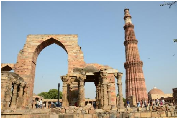
กุตูป มินาร์ (Qutb Minar) กรุงนิวเดลี สิ่งก่อสร้างในสมัยสุลต่านแห่งเดลี

ในช่วงคริสต์ศตวรรษที่ ๗-๑๐ เป็นช่วงที่อินเดียอยู่ในสภาวะความวุ่นวายทางการเมือง อินเดียต้องเผชิญการรุกรานของพวกมุสลิม นั่นคือ มุสลิมเชื้อสายเติร์กจากเอเชียกลาง เข้าปกครองอินเดียภาคเหนือ และเผยแพร่ศาสนาอิสลามเข้าสู่ดินแดนเอเชียใต้ ในช่วงเวลาเดียวกันทางตอนใต้ของอินเดีย อาณาจักรโจฬะ ได้เจริญรุ่งเรืองขึ้น อาณาจักรแห่งนี้ถือได้ว่าเป็นแหล่งที่มั่นของศาสนาพราหมณ์-ฮินดูในอินเดีย อีกทั้งยังมีความเจริญทางด้านการค้าเป็นอย่างมาก