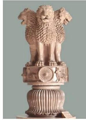
สถูปสาญจีและเสาหินพระเจ้าอโศกมหาราช