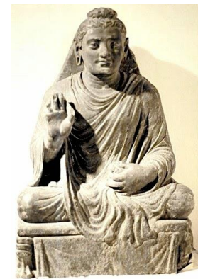
พระพุทธรูปแบบคันธาระ