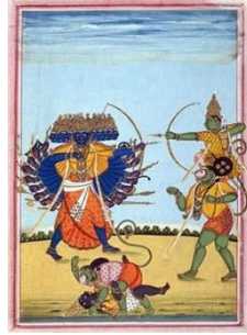
มหากาพย์มหาภารตะและมหากาพย์รามายณะ