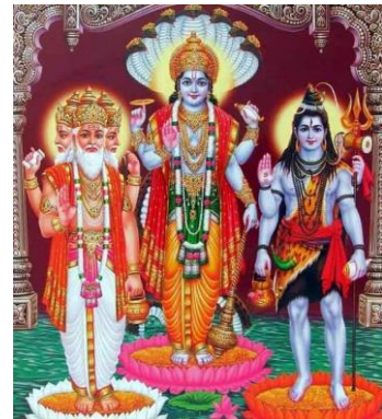
เทพเจ้าสูงสุดของศาสนาพราหมณ์-ฮินดู จากซ้ายไปขวา พระพรหม พระวิษณุ พระศิวะ

ในการนับถือพระเจ้าหลายองค์ โดยเทพเจ้าสูงสุดของศาสนาพราหมณ์ คือ พระศิวะ หรือ พระอิศวร เป็นเทพเจ้าที่มีอำนาจสูงสุด พระวิษณุ หรือ พระนารายณ์ ซึ่งจะอวตารลงมาเกิดในโลกมนุษย์เพื่อดับทุกข์เข็ญ และ พระพรหม ผู้สร้างโลก พราหมณ์เป็นผู้ที่ติดต่อกับเทพเจ้าได้ด้วยการประกอบพิธีกรรมและร่ายบทสวดมนต์บูชาเทพเจ้าตามคัมภีร์พระเวท ดังนั้นจึงมีบทบาทสำคัญในสังคมอินเดีย อนึ่ง ศาสนายังสอนให้คนยอมรับเรื่องการเวียนว่ายตายเกิด ทำให้ชาวอินเดียยอมรับชะตากรรมของตนในโลกปัจจุบัน ซึ่งรวมถึงการดำรงอยู่ในวรรณะที่ถูกกำหนดมาตั้งแต่เกิด แล้วมุ่งทำความดีเพื่อจะได้หลุดพ้นจากวัฏสงสาร จึงนับว่าศาสนาพราหมณ์มีอิทธิพลสำคัญต่อการหล่อหลอมความคิด ความเชื่อ และวิถีชีวิตของชาวอินเดียมาก