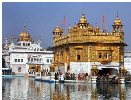
สุวรรณวิหาร เมืองอัมริตซาร์ ศาสนสถานสำคัญของศาสนาซิกข์

ต่อมาในปี ค.ศ.๑๒๐๖ ผู้นำมุสลิมเชื้อสายเติร์ก จักรรัฐอิสลามในบริเวณอัฟกานิสถานได้ก่อตั้ง ราชวงศ์มัมลุก แต่เนื่องจากเมืองหลวงตั้งอยู่ที่เมืองเดลี จึงเรียกว่า สุลต่านแห่งเดลี (คริสต์ศตวรรษที่ ๑๓-๑๖) การยึดครองอินเดียของพวกมุสลิมได้ก่อให้เกิดการแลกเปลี่ยนทางวัฒนธรรมซึ่งกันและกัน เป็นต้นว่ามีการนำภาษาเปอร์เซียเข้ามาใช้ในราชสำนัก ซึ่งต่อมาได้กลายเป็นภาษาอูรดูซึ่งผสมผสานจากภาษาเปอร์เซีย สันสกฤต และอาหรับ ส่วนทางด้านศิลปกรรมก็มีการสร้างมัสยิด พระราชวัง หอคอย ฯลฯ ซึ่งผสมผสานศิลปะของมุสลิมกับฮินดู ทางด้านศาสนา ในปี ค.ศ.๑๕๖๙ ก็เกิดศาสนาใหม่ซึ่งนำหลักของศาสนาอิสลามกับฮินดูมาหลอมรวมกันเกิด