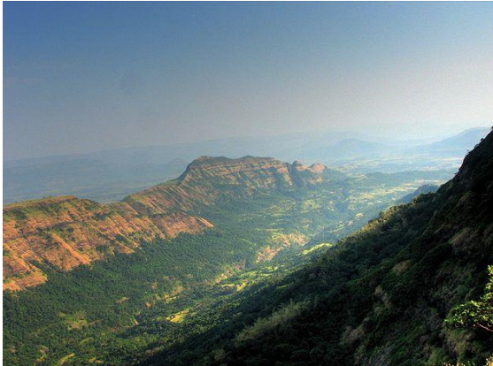
ที่ราบสูงเดคคาน