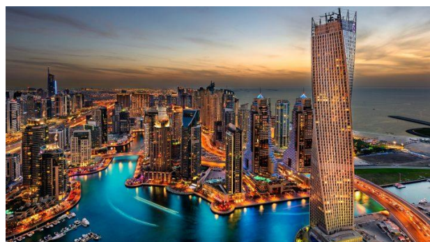
เมืองมุมไบ เมืองท่าสำคัญทางฝั่งตะวันตกของอินเดีย

จากแผนที่ทะเลของอินเดีย นั้น ชายฝั่งบนแผ่นดินใหญ่ของอินเดียประกอบด้วยหาดทรายถึงร้อยละ ๔๓ กรวดและหินร้อยละ ๑๑ รวมถึงหน้าผา และร้อยละ ๔๖ เป็นดินเลนและโคลน ในปัจจุบันชายฝั่งทะเลทั้งสองมีเมืองที่สำคัญ เช่น เมืองมุมไบทางฝั่งตะวันตก เมืองเจนไนและเมืองวิศาขาปัตตนมทางฝั่งตะวันออก เป็นต้น