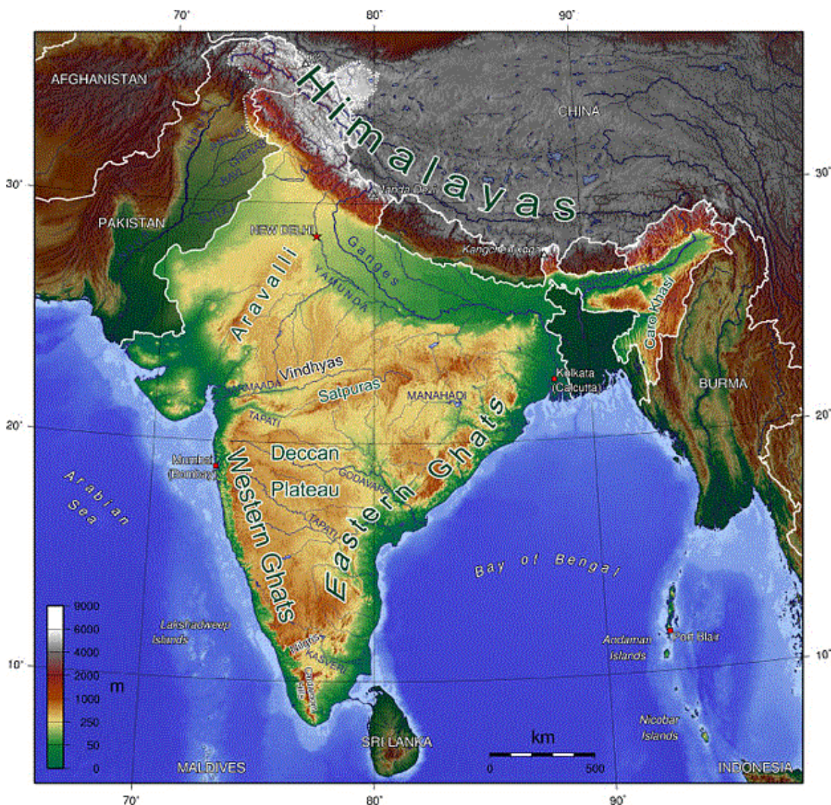
แผนที่แสดงลักษณะภูมิประเทศของภูมิภาคเอเชียใต้