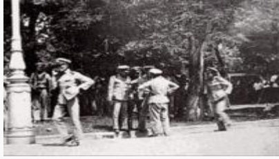
ทหารพระเอกกำลังที่ลานพระราชวังดุสิต 24 มิถุนายน 2475